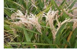
চিত্র: মরা শীষ বা হোয়াইট হেড