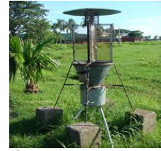
চিত্র: আলোক ফাঁদ

প্রচারেঃ কীটতত্ত্ব বিভাগ, বাংলাদেশ পরমাণু কৃষি গবেষণা ইনস্টিটিউট, ময়মনসিংহ